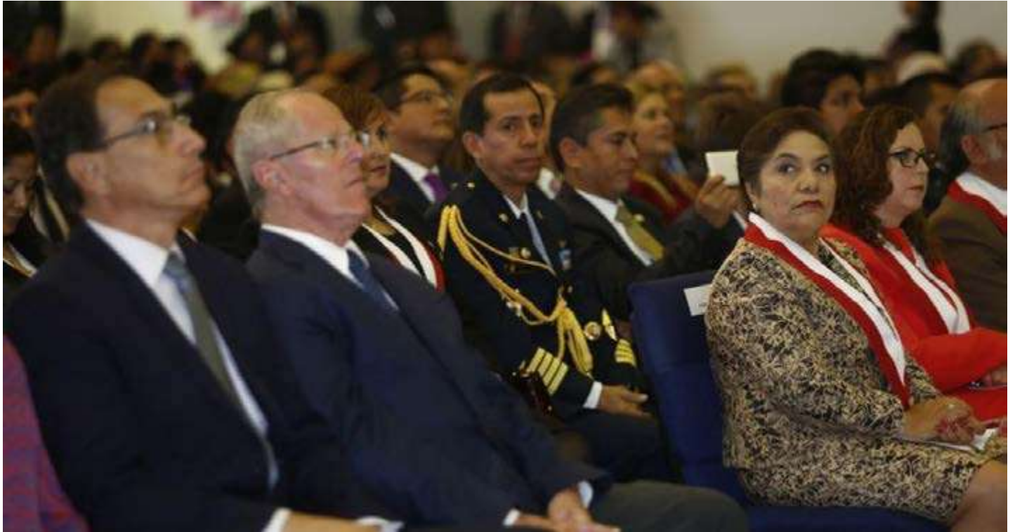
Ceremonia del TeDeum Evangélico, 2017.