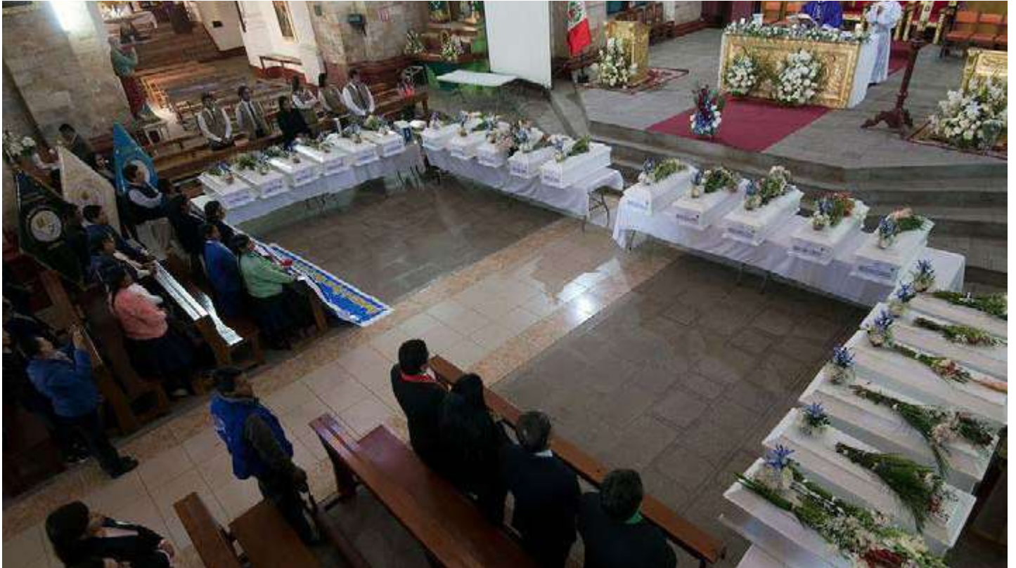
Imagen: Misa celebrada en la catedral Huanta a propósito de la entrega de 23 personas desaparecidas identificadas a sus familiares.

la violencia y sus consecuencias en el presente. De ellas, una de las más dramáticas es la incertidumbre de las familias que buscan a personas desaparecidas. Es así que el presente trabajo trata sobre los esfuerzos estatales en nuestro país para emprender dicha búsqueda.