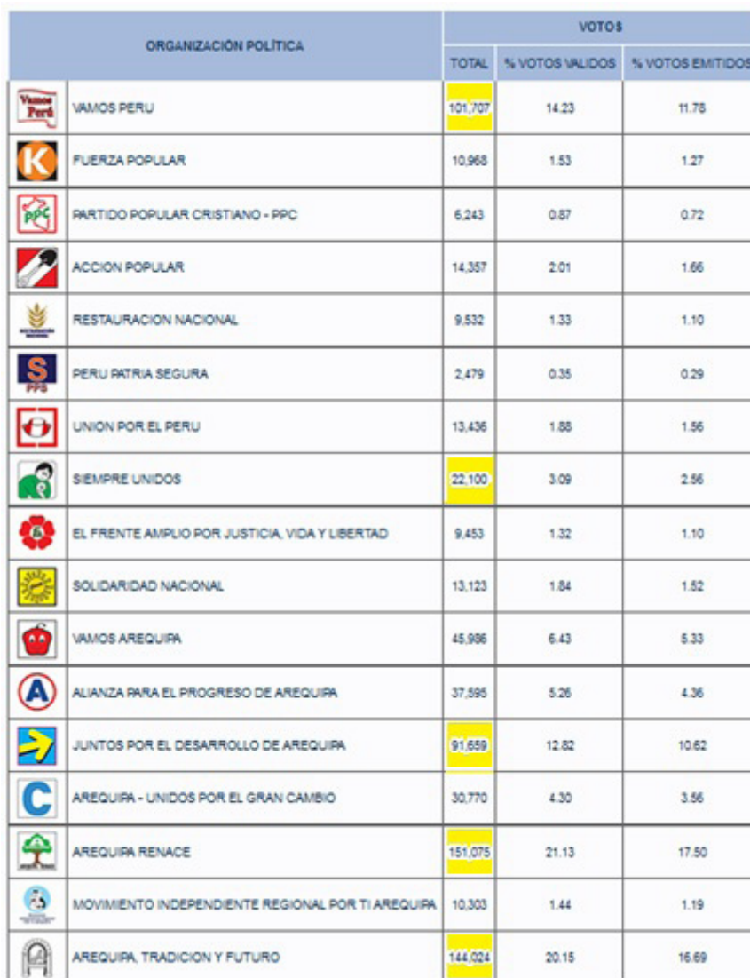
Cuadro 2. Resultados de las elecciones de la región Arequipa, 2014**