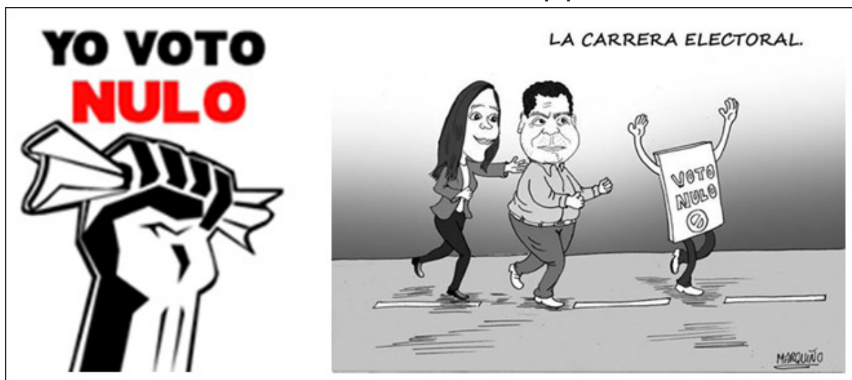
Gráfico 2 Voto blanco/viciado en Arequipa, 2014

El fantasma del voto en blanco se inició como una campaña a través de redes sociales 9 (ver gráfico 2) y con declaraciones de excandidatos que lo promovían. 10